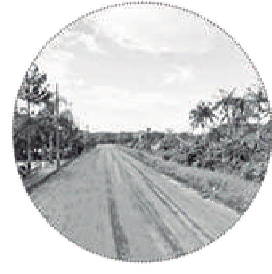
Rua marginal e espaço residual sem infraestrutura