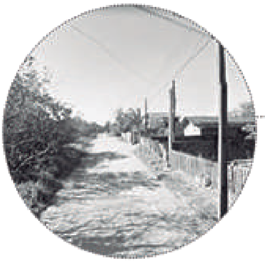
Ruas marginais muito próximas ao mangue e sem infraestrutura