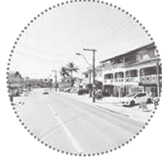
Rua troncal com solo impermeável e ocupação aquém da legislação